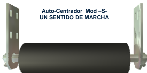
Auto-Centrador Mod -S- UN SENTIDO DE MARCHA