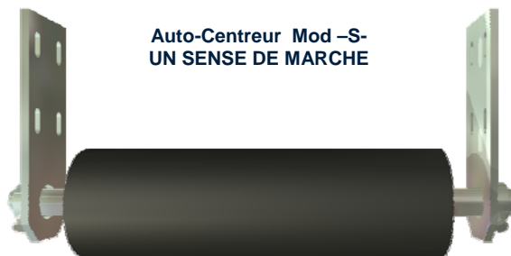
Auto-Centreur Mod -S- UN SENSE DE MARCHÉ